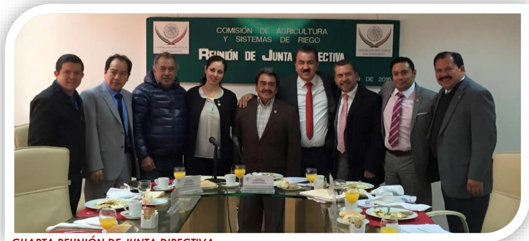
CUARTA REUNIÓN DE JUNTA DIRECTIVA