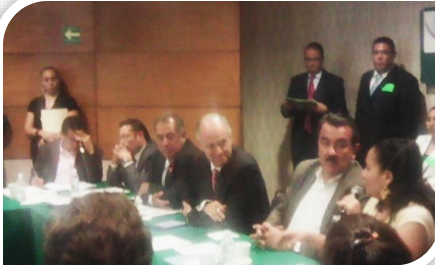
Reunión con Financiera Rural