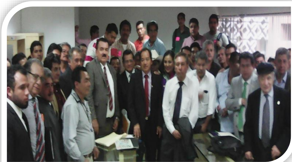
Reunión con Cafeticultores