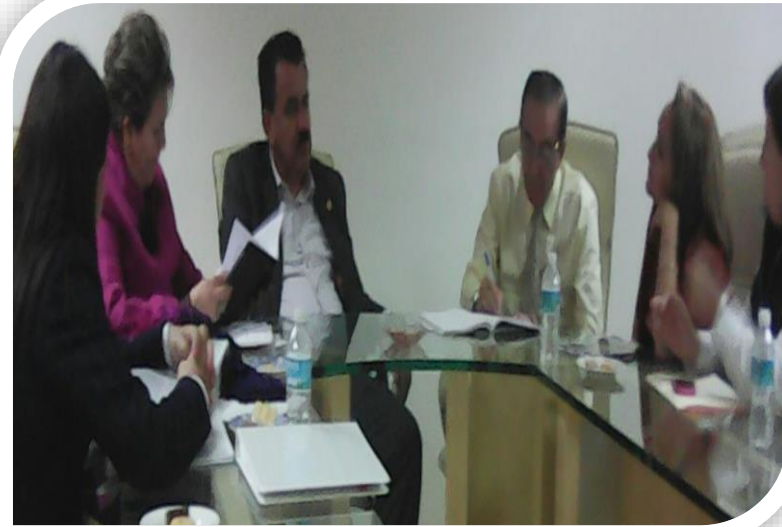
Reunión con Diputadas de Guerrero