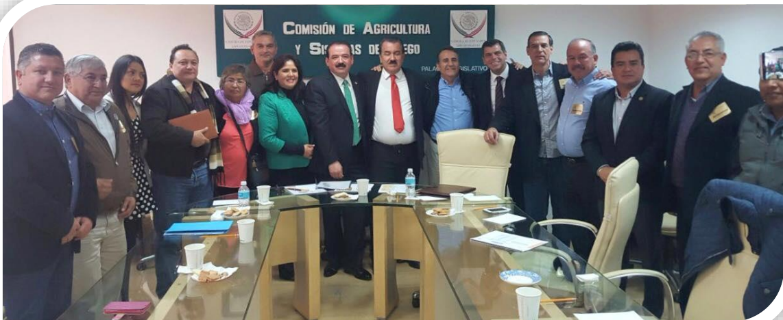
Reunión con Citricultores