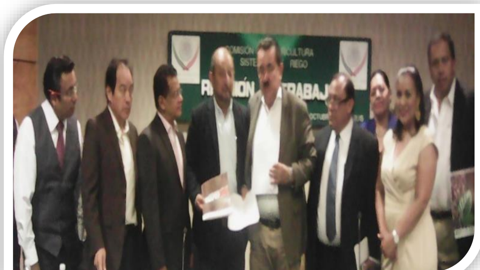
Organizaciones de Oaxaca