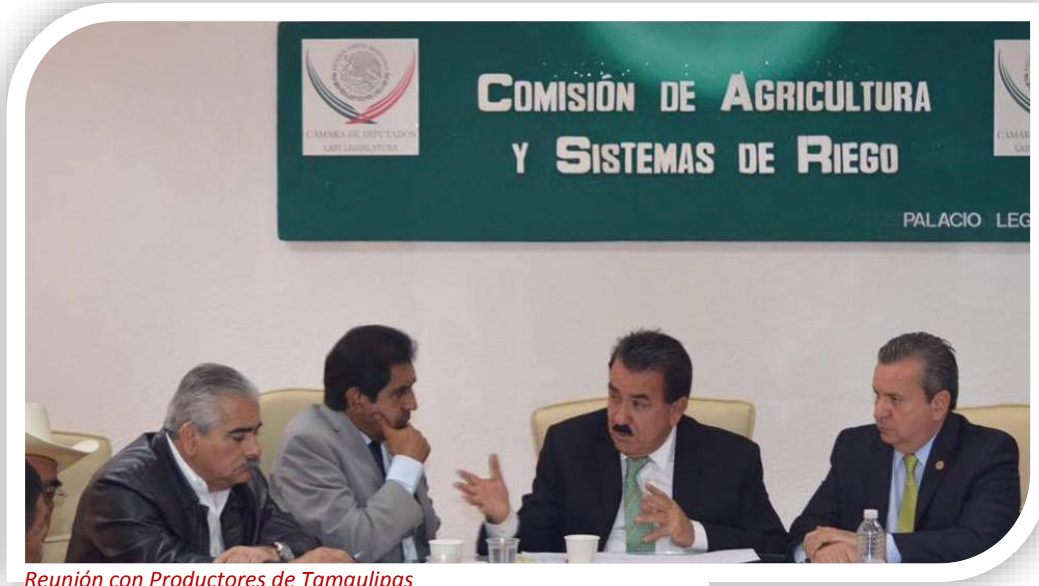
Reunión con Productores de Tamaulipas