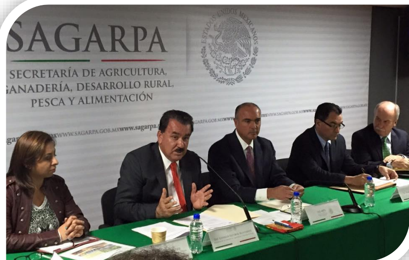
Reunión con SAGARPA