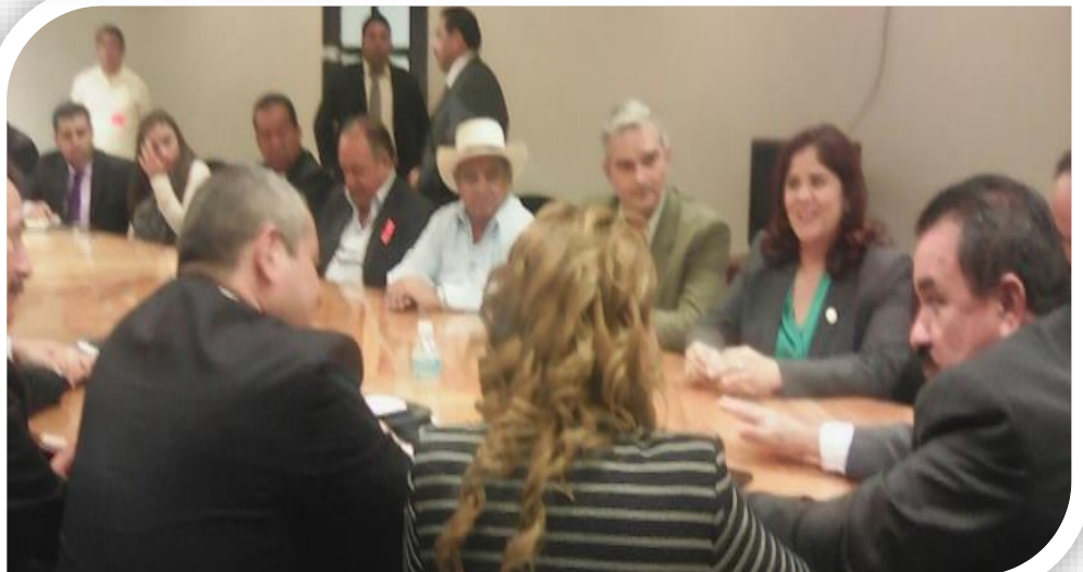
Reunión SENASICA y Comités de Sanidad Estatales