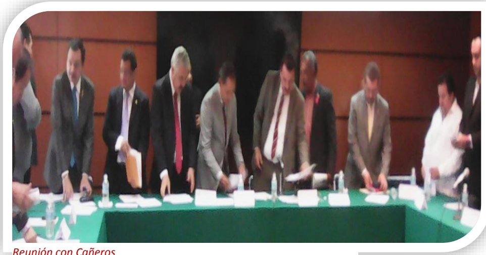
Reunión con Cañeros