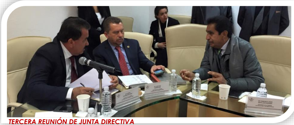
TERCERA REUNIÓN DE JUNTA DIRECTIVA